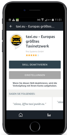
Skill taxi.eu activé dans l'application du compte client Amazon

commande un taxi avec taxi point eu ! ». la commande est lancée. « OK, tu veux être pris en charge à ton adresse de prise en charge. C'est correct ? » répond le haut-parleur avec la voix charmante d'Alexa. Tout ce que le passager doit faire c'est dire « Oui ». Une commande est alors lancée via la plus