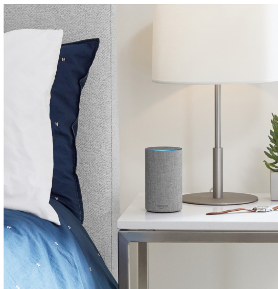
Le grand haut-parleur à commande vocale Amazon Echo

Les centraux de taxis fms identifient la commande placée avec Amazon Echo comme commande via l'application. Actuellement, Amazon Echo est lancée en Allemagne et en Autriche. Successivement, l'offre sera déployée à travers toute l'Europe.