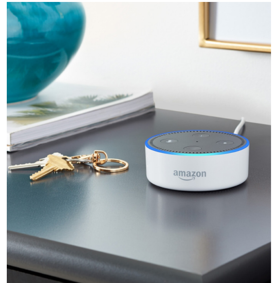
Le petit haut-parleur à commande vocale Amazon Echo dot

grande communauté de taxis en Europe. Le passager peut également demander à quelle heure le taxi sera devant chez lui. Pour cela, il suffit de dire « Alexa, demande à taxi point eu quand mon taxi sera devant chez moi ! » pour obtenir une réponse fiable. Si le passager change d'avis, il peut dire : « Alexa, annule le taxi auprès de taxi point eu ! » et la commande est automatiquement