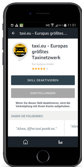
Aktiviertes taxi.eu Skill in der App des Amazon-Kundenkontos

Mit den Worten „Alexa, bestell mir ein Taxi mit taxi punkt eu!“